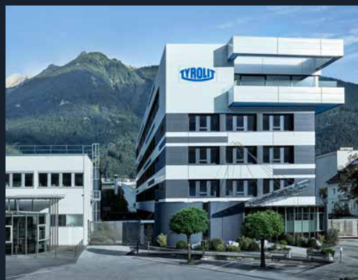
La sede centrale TYROLIT di Schwaz, Austria.

Subscribe our channel youtube.com/TYROLITgroup