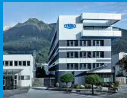
Siège social de Tyrolit à Schwaz (Autriche)

Cette entreprise familiale, dont le siège social se situe à Schwaz (Autriche), combine les forces du Groupe Swarovski dynamique dont elle fait partie avec une expérience d'entreprise individuelle et technologique longue d'un siècle.