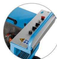
Pannello di controllo ben visibile